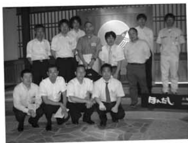
実地研修(食品包装コース)