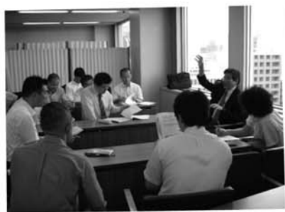
実力養成総合演習(1)