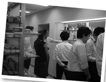
実地研修(包装材料コース)