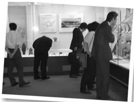
実地研修(医薬品包装コース)