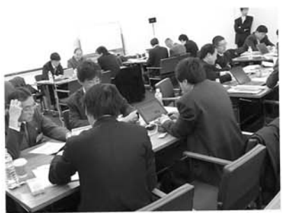
実力養成総合演習(2)