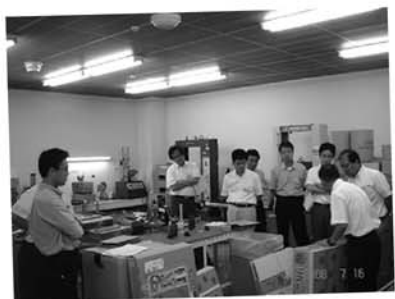
実地研修(輸送包装コース)