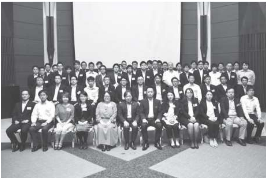
2019年度 包装専士講座受講生