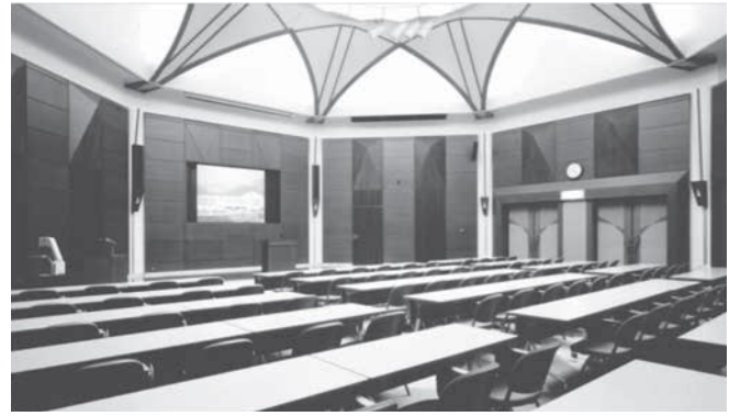
開講式・オリエンテーション・共通教科I(合宿研修) 研修室