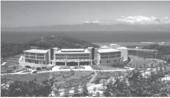
開講式・オリエンテーション・共通教科I(合宿研修) 会場