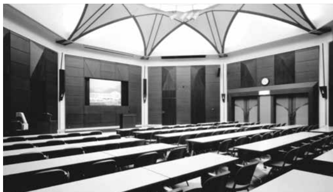
開講式・オリエンテーション・共通教科I(合宿研修) 研修室