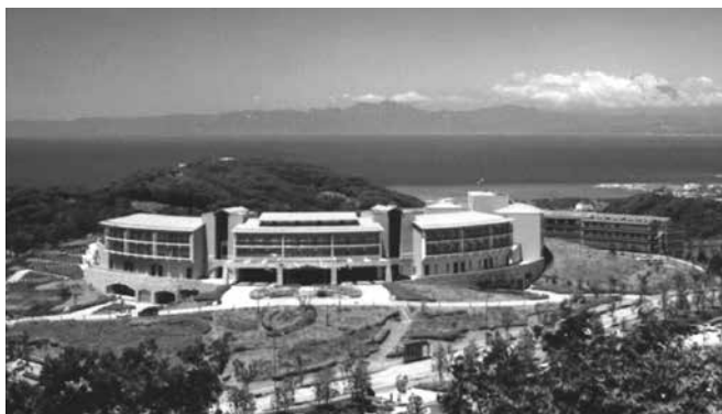
開講式・オリエンテーション・共通教科I(合宿研修) 会場