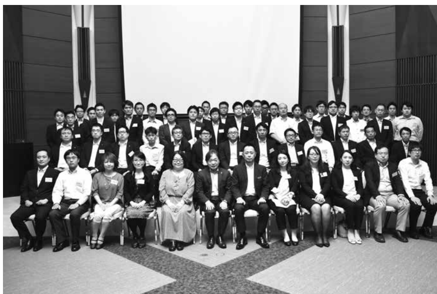
2019年度 アカデミー全受講生