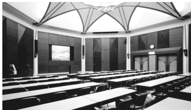
開講式・オリエンテーション・共通教科I(合宿研修) 研修室