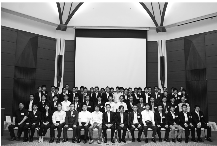
平成28年度 アカデミー全受講生