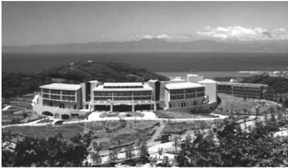
開講式・オリエンテーション・共通教科I(合宿研修) 会場