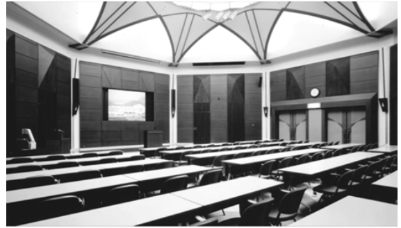
開講式・オリエンテーション・共通教科I(合宿研修) 研修室