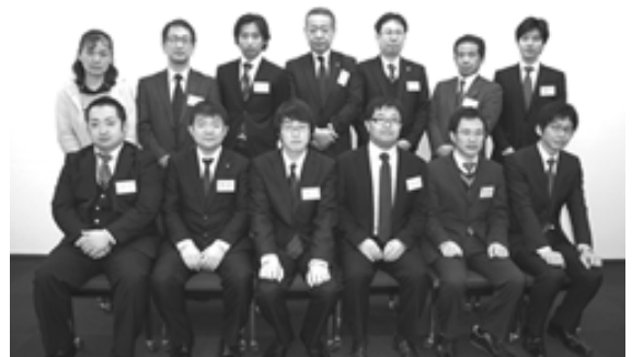
平成25年度 医薬品包装コース受講生