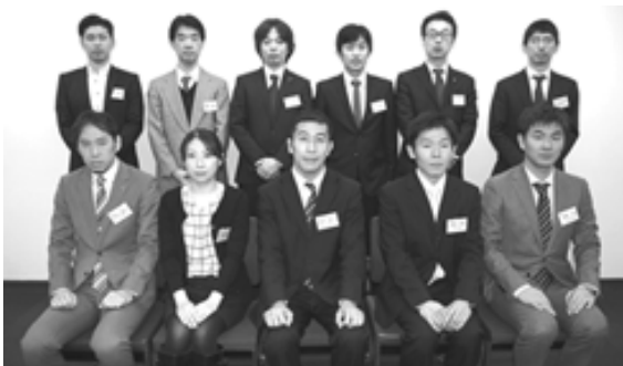
平成25年度 輸送包装コース受講生