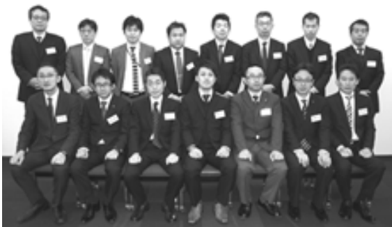
平成25年度 包装材料コース受講生