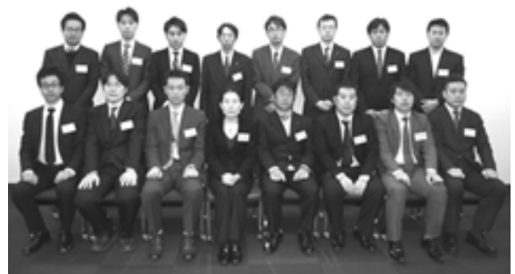
平成25年度 食品包装コース受講生