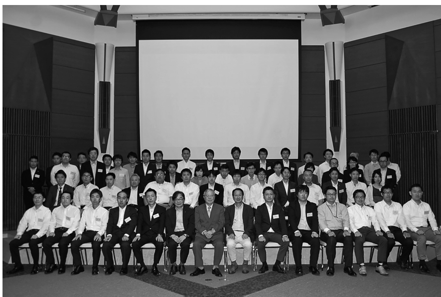
平成30年度 アカデミー全受講生